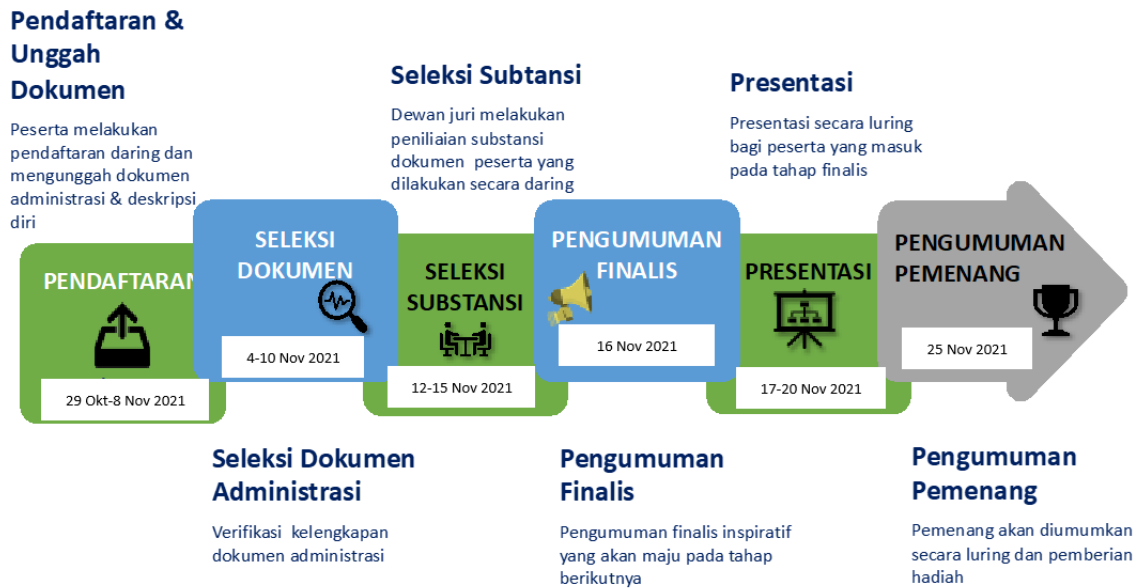
Gambar 1. Diagram Alur Pelaksanaan Kegiatan